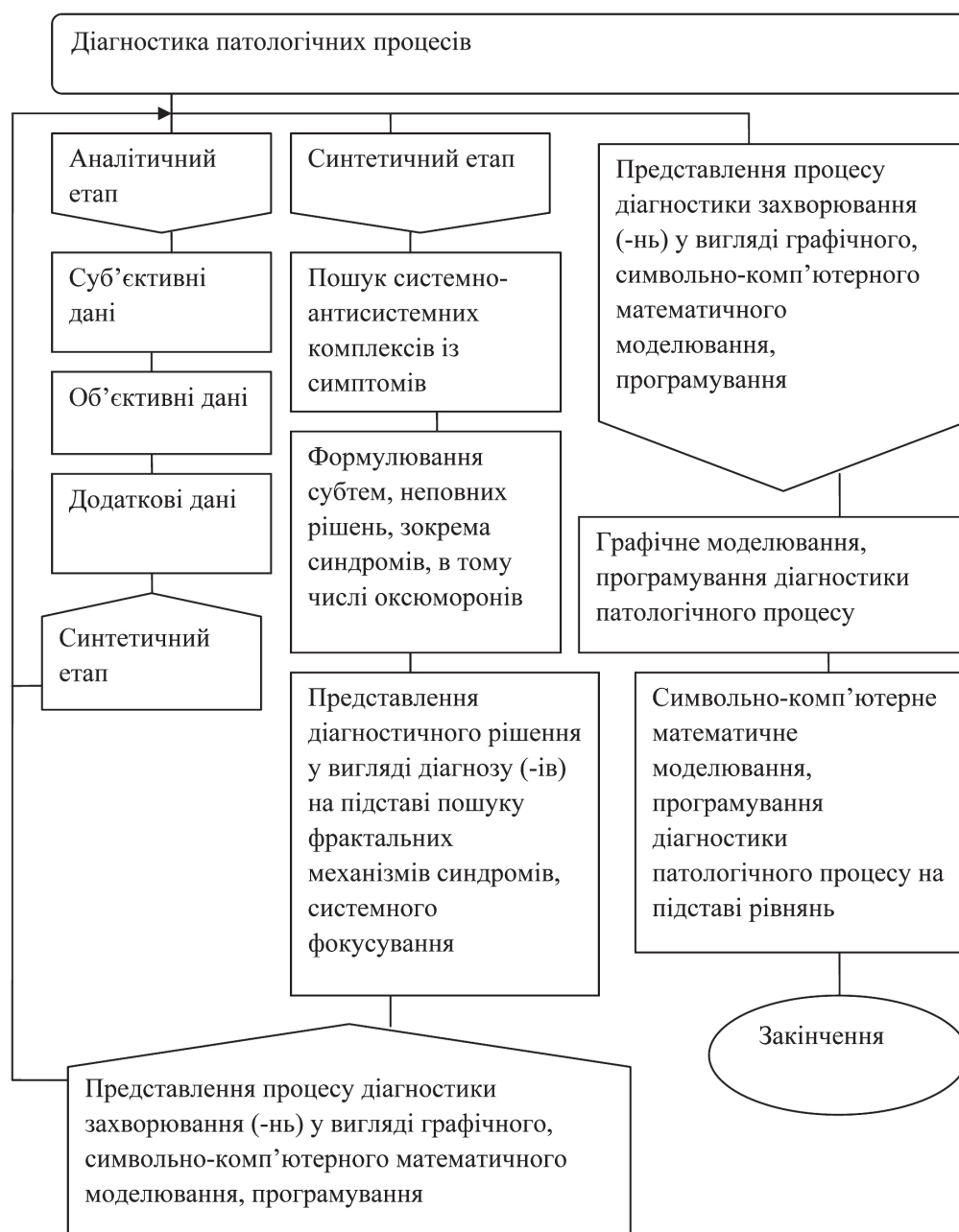
Рис. 1. Діагностика патологічних процесів.

Модель необхідна [1] для розуміння того, як влаштовано конкретний об'єкт, процес, зокрема його